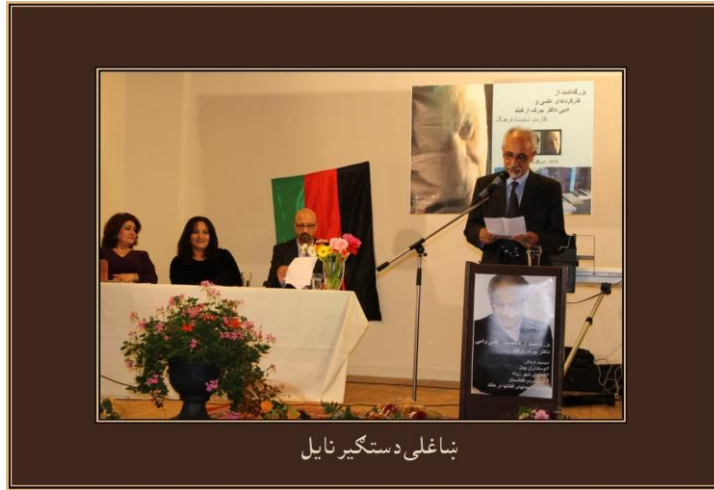
د ښاغلي دستگير ناييل