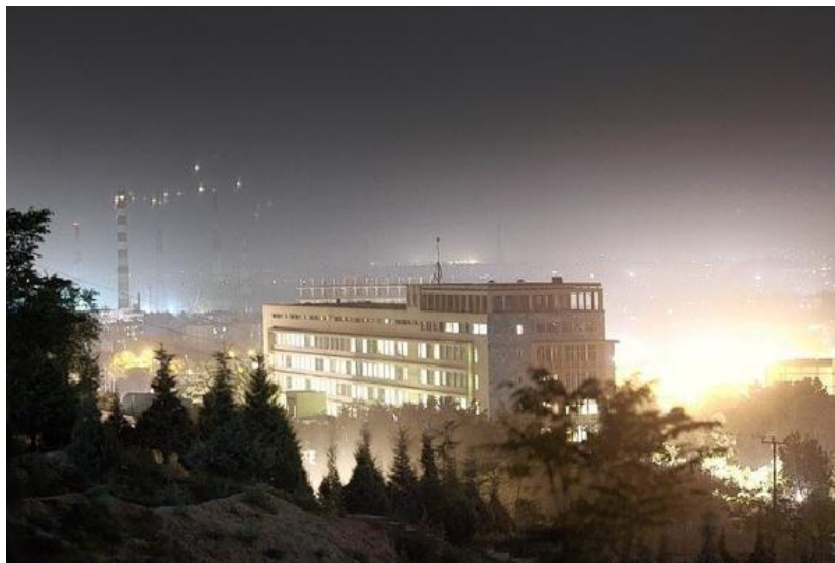
شفاخانه نظامی سردار محمد داود خان

در شفاخانه نظامی افغانستان (بودجه آن توسط ایالات متحده امریکا تامین می شود)، در جریان ماه جاری (جولای سال ۲۰۱۲) اطلاعاتی از صورت معالجه و برخورد نادرست مسوولین آن شفاخانه برملا شده است.