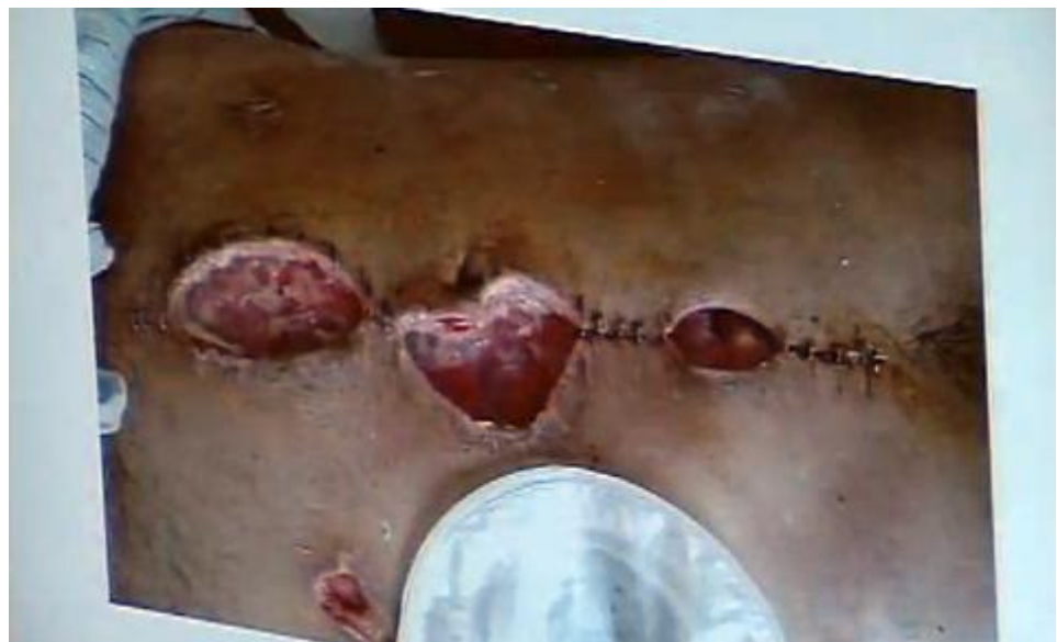
تصویر مریضی که زخمهایش تداوی نشده است