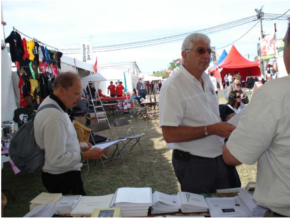
بازدید کننده گان از حضور دوبارهٔ چپ افغانی در قطار سازمانهای مترقی جهان اظهار رضایت و خوشنودی کردند.